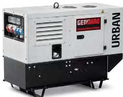
Изображение только для иллюстрации