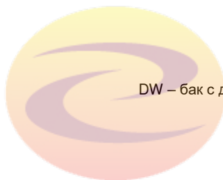
DW – бак с двойными стенками